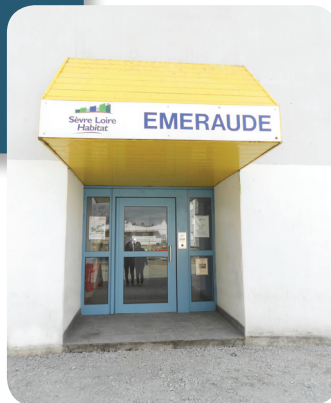
SESSAD Pro 16 - 20 ans