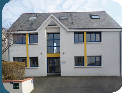
SESSAD 0- 16 ans

Ces enfants ou jeunes présentent un handicap qui a été reconnu par la Maison Départementale de l'Autonomie. Sont considérés comme personnes handicapées, les personnes qui ont un retard global des acquisitions, une limitation des capacités d'adaptation et des difficultés durables pour se représenter elles-mêmes.